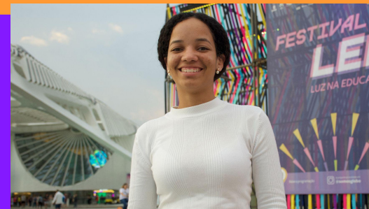
Isabela - Jovens Líderes pela Paz (DF)