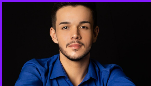
Embaixador Felipe Brigunte - Olimpíadas de Educação Política do Brasil (MG)