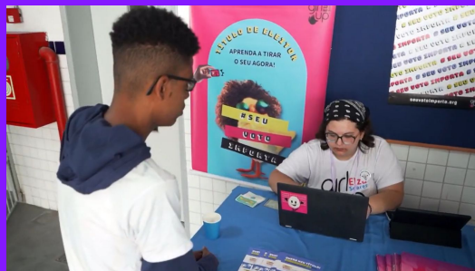
Grupos de Jovens se mobilizam para incentivar adolescentes de 16 e 17 anos a solicitar o título de eleitor