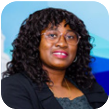
Neully GOHI LOU Digital women Active Africa Education et Formation Côte d'Ivoire

Cette initiative vise à améliorer le bien-être des enfants démunis et orphelins en leur offrant des dons, une formation en activités génératrices de revenus et un accompagnement éducatif pour leur insertion sociale et professionnelle. Depuis 2021, elle a impacté plus de 2 000 jeunes grâce à des collaborations avec 8 associations et des experts. Son approche novatrice combine formation et suivi pour répondre aux défis liés à l'éducation et à la santé. Dans les 12 à 24 prochains mois, elle ambitionne une reconnaissance nationale et un élargissement de son action à la sous-région et aux partenaires internationaux.